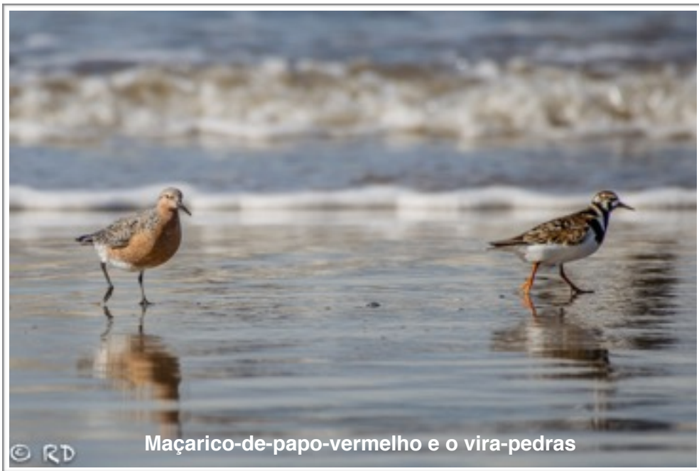
Maçarico-de-papo-vermelho e o vira-pedras