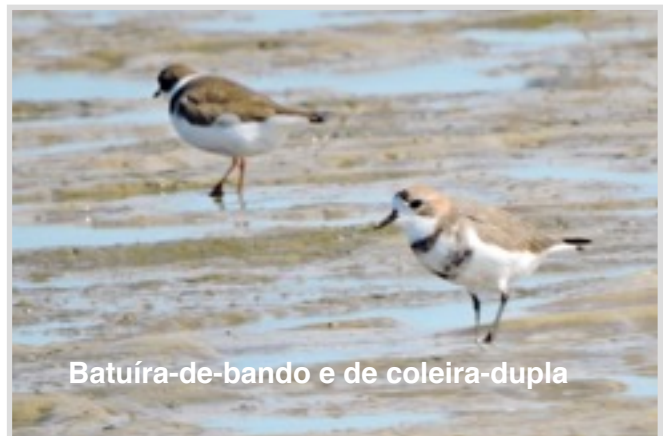
Batuíra-de-bando e de coleira-dupla