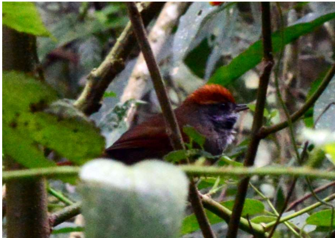
Pichororé ( Synallaxis ruficapilla ).