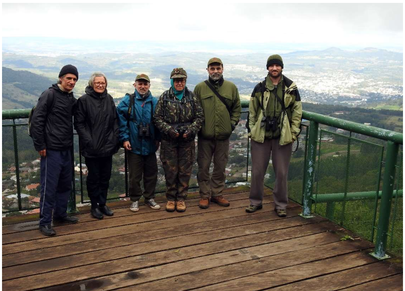
Grupo de observadores no mirante do Morro da Embratel, em Morro Reuter.