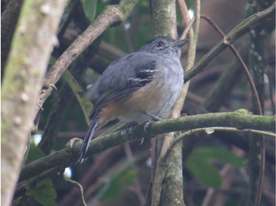
Choca-da-mata ( Thamnophilus caerulescens ).