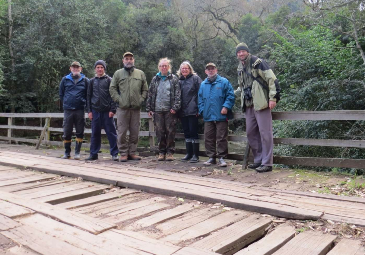
Participantes da saída na ponte do rio Loch, divisa entre Morro Reuter e Sta. Maria do Herval.

No dia 08 de julho de 2018, o Clube de Observadores de aves de Porto Alegre – COA/POA realizou sua quarta saída de campo oficial para observação de aves nos municípios de Morro Reuter (MR) e Santa Maria do Herval (SMH). O local é formado por morros que chegam a altitudes de pouco mais de 600 m, com áreas remanescentes consideráveis de Mata Atlântica.