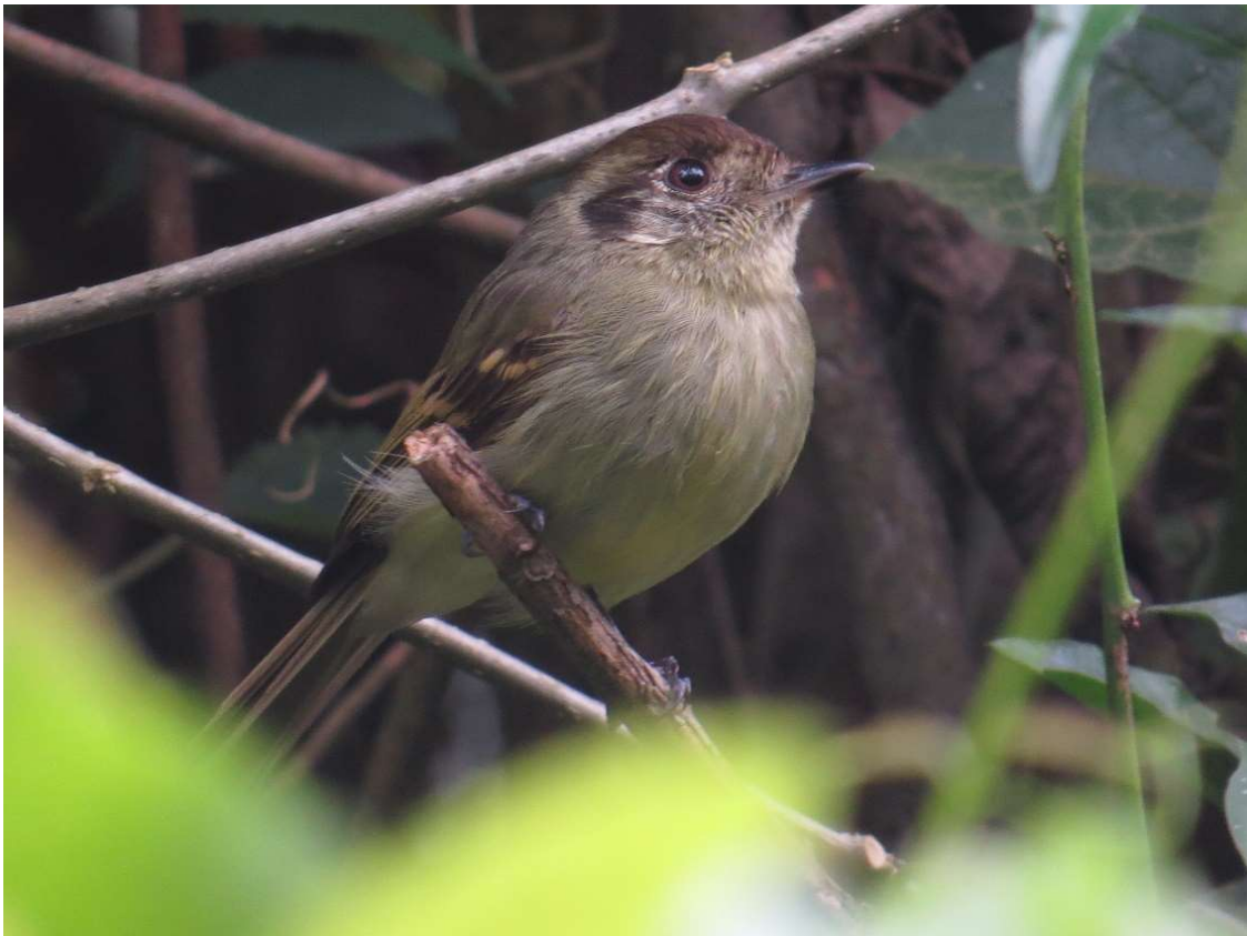
Cabeçudo ( Leptopogon amaurocephalus ).