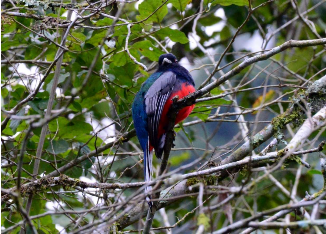
Surucuá-variado ( Trogon surrucura ).