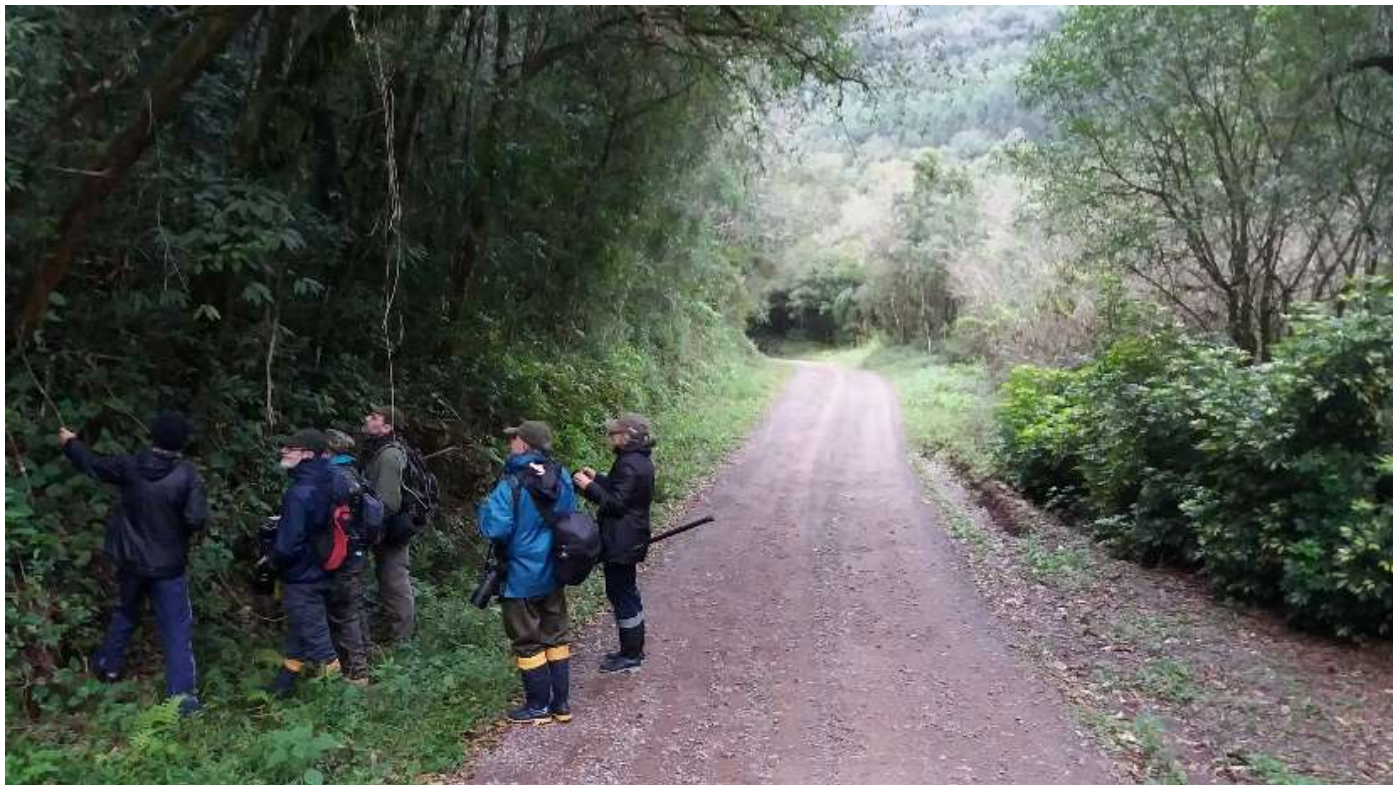
Grupo de observadores na estrada de Santa Maria do Herval.