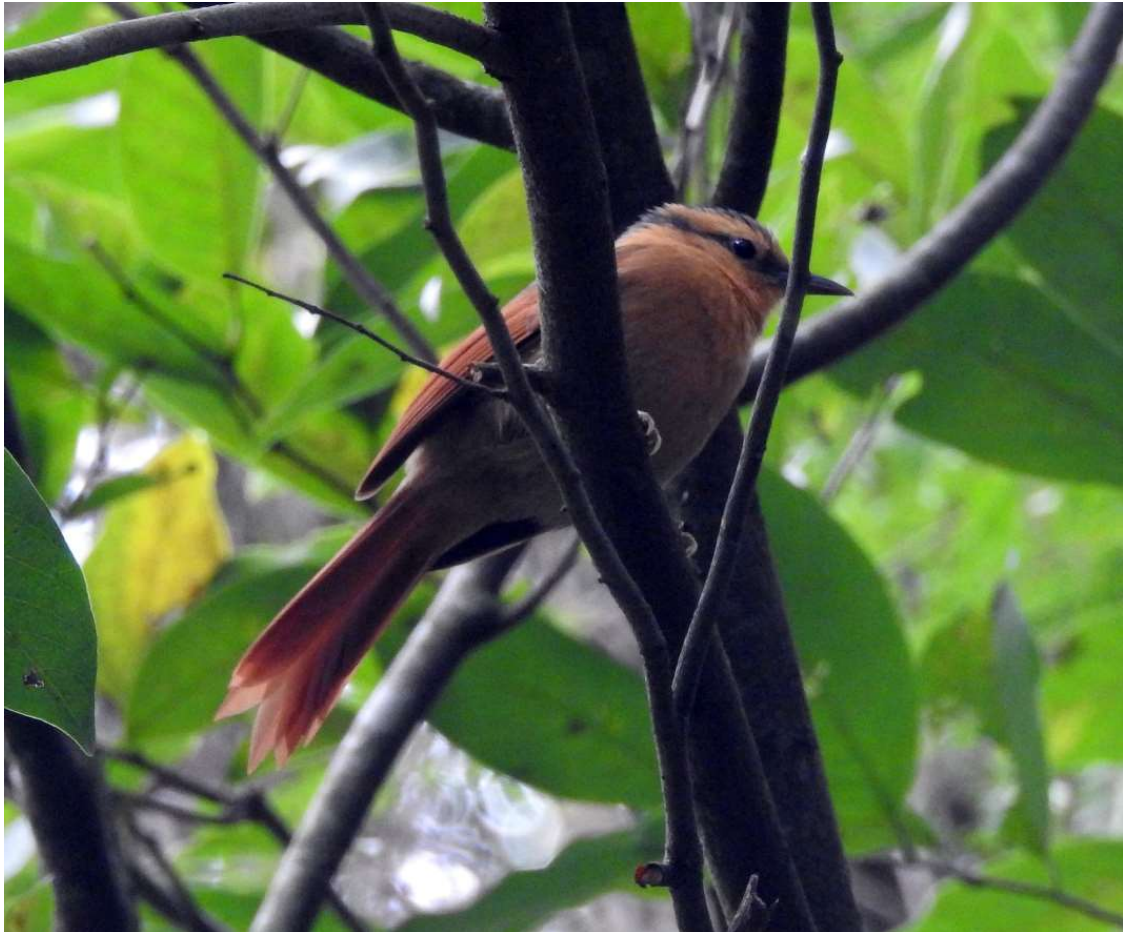
Limpa-folha-de-testa-baia ( Philydor rufum ).