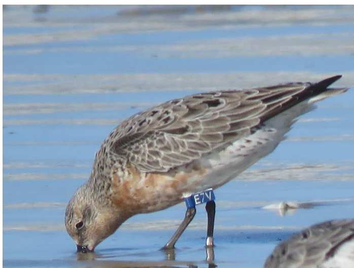
Maçarico-de-papo-vermelho marcado com bandeirola azul, que indica o Brasil como país onde a ave foi marcada, pela equipe de pesquisa, no Litoral do Rio Grande do Sul.