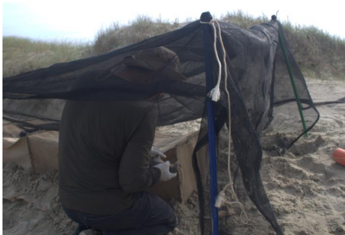
Captura de maçarico-de-papo-vermelho para colocação de GPS de monitoramento via satélite e marcação com bandeirolas alfanuméricas coloridas.

Com isto a equipe envolvida na pesquisa espera fornecer subsídios para criação e adoção de medidas de conservação do ambiente e por consequência traga proteção para a espécie objeto da pesquisa e para as outras aves limícolas migratórias.