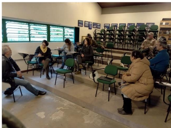
Acima, reunião do Conselho do RVSBP e abaixo reunião na sede da Reserva do Lami.